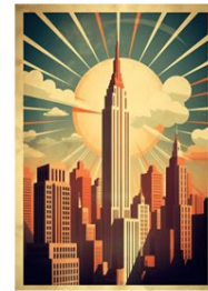
Art Deco wijst de organische vormen af ten gunste van rechte lijnen

Al snel na het beginnen met onderzoeken over de stijlperiode leerde ik over het grote gebruik van organische vormen in deze stijlperiode (Bron 1). Dit gaf de kunstwerken een speelser en natuurlijker gevoel*. Mijn deel werd op grote wijze beïnvloed door het ontstaan van de eerste massacommunicatiemiddelen rond deze tijd. Hiervoor kon kunst en design alleen worden gevonden in musea en galerijen maar rond de tijd van Art Nouveau ontstonden ook bijvoorbeeld posters. Hierdoor had het algemene publiek een veel dichtere band met de kunststijl. Ik vond het erg interessant om te zien hoe de kunststijl nog steeds veel inspiratie levert in moderne kunstvormen, specifiek de moderne architectuur. Hier worden nog steeds vaak organische vormen gebruikt om gebouwen een interessanter figuur te geven en om contrast te bouwen met de vaak rechte gebouwen er omheen*. Op de presentatie hebben wij de volgende feedback ontvangen.