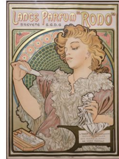
Parfumadvertentie door Alphonse Mucha

Waar Art Nouveau organische vormen van planten en bloemen nabootst, neemt het Expressionisme ze van grotten en bergen